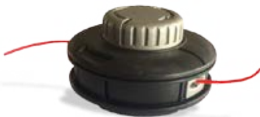
63019017 Tap-N-Go Fácil Recarga. Tapa de golpe de aluminio.

CABEZAL HEMBRA TAP-N-GO FÁCIL RECARGA P/HILO DE 2.4MM A 3.3 MM P/ST FS400/FS450/FS460 CON TUERCA INTERCAMBIABLE PARA USAR CON LOS MODELOS FS100/FS120/FS160/FS200 P/HILO DE 2.4 MM A 2.7MM