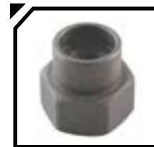
50709007 Tap-N-Go Fácil Recarga. Tapa de golpe de aluminio.