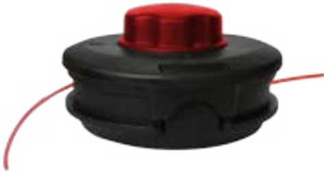
61130055 Tap-N-Go Fácil Recarga. Tapa de golpe de plástico.